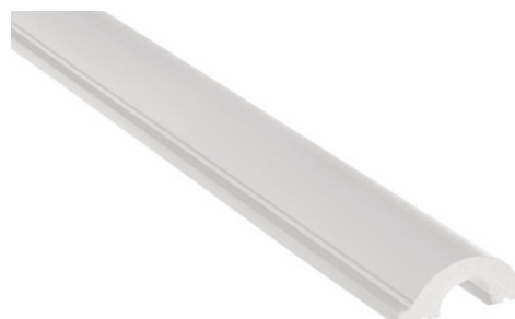
PROFIL DE CAPĂT DREAPTA