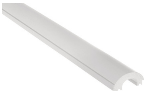
PROFIL DE CAPĂT STÂNGA